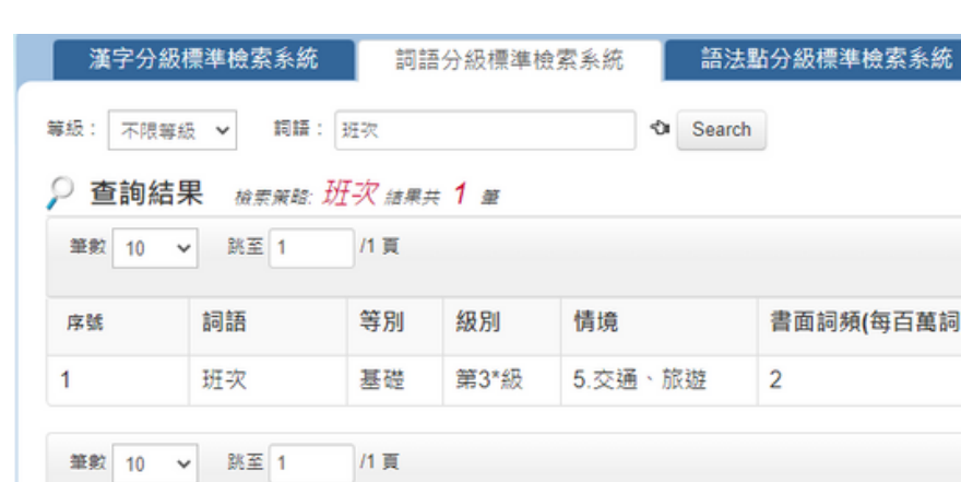
詞語分級標準檢索系統