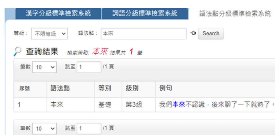
語法點分級標準檢索系統