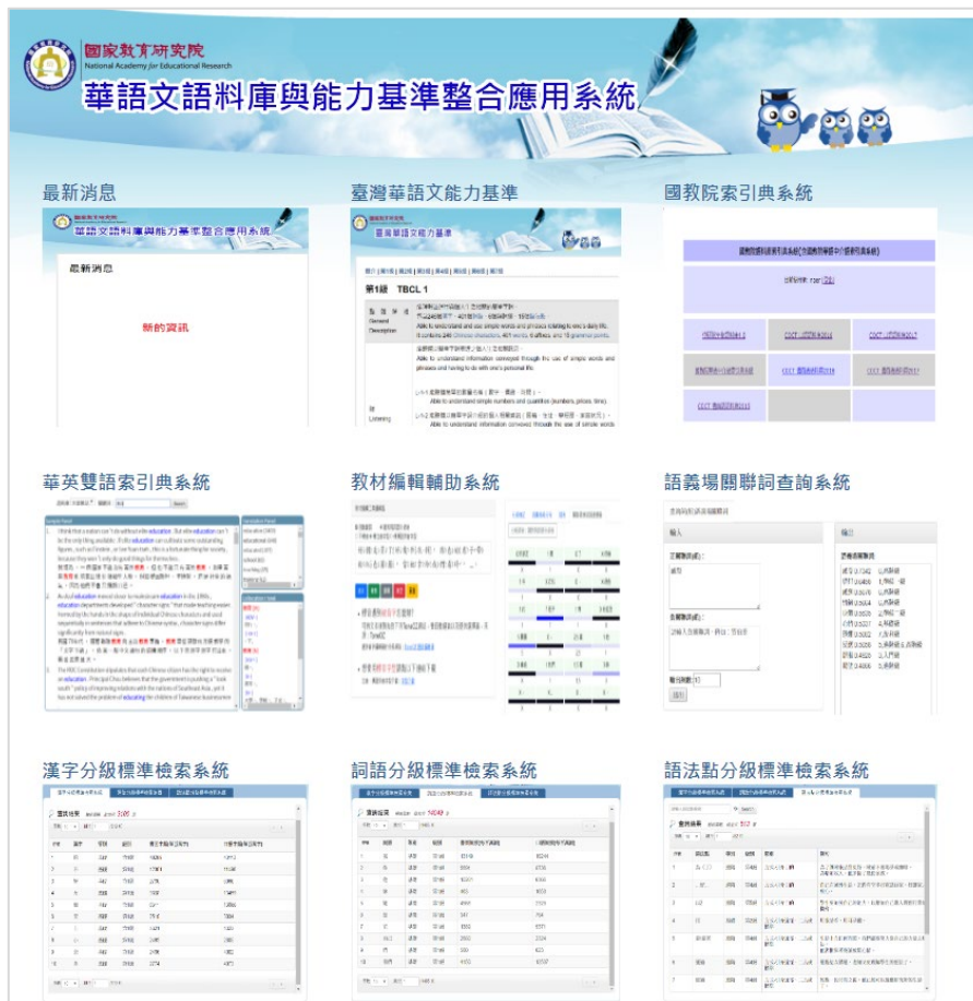
圖三：華語文語料庫與能力基準整合應用系統，網址 https://coct.naer.edu.tw/